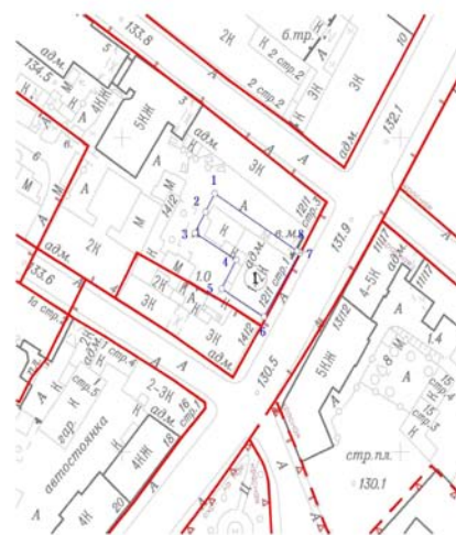
Координаты границ земельного участка